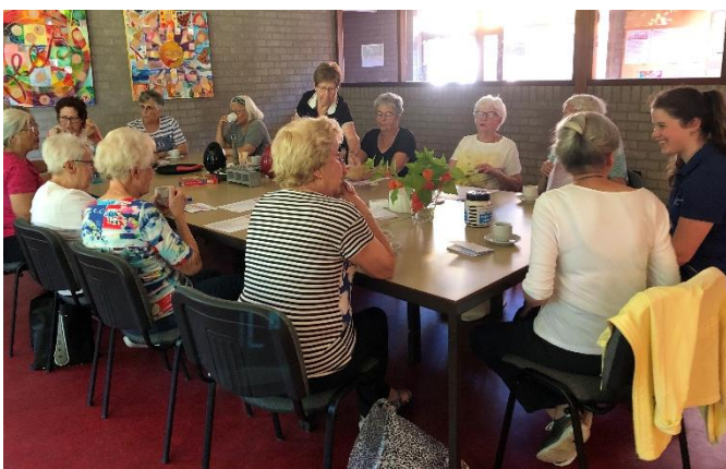
"Koffie-uurtje na afloop van de Beweggroep"

Het bestuur heeft dit advies in haar bestuursvergadering unaniem overgenomen en dit is bekrachtigd in een besluit door de gemeenteraad. Mochten er na deze uitleg en over het gevolgde proces nog vragen zijn, dan ontvangen wij graag reactie via itterlaeftj@gmail.com en gaan we samen in gesprek.