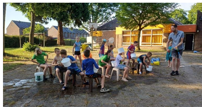
"Waterspellen tijdens groepsavond Jong Nederland"

Kortom het toekomstbestendig dorps huis bestaat niet enkel uit een grote zaal en een café en wordt voor en door vrijwilligers georganiseerd. Het ging daarnaast ook over een voor iedereen toegankelijk (gelijkvloers) gebouw en de mogelijkheden voor jong en oud op een buitenterrein.