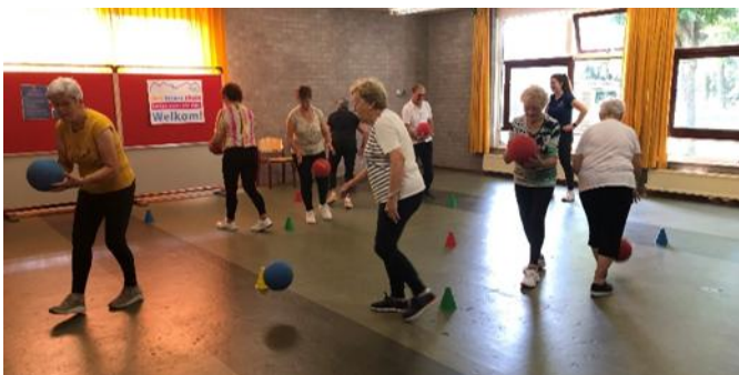
"55+ Beweggroep onder leiding van fysiotherapeut"

Er hebben zich toen 5 inwoners aangemeld die plaats hebben genomen in de commissie. Na grondige bestudering van alle documenten en de drie locatieonderzoeken heeft de commissie het bestuur van Itter Laeftj unaniem geadviseerd om de voormalige school als locatie voor het toekomstige dorps huis te kiezen. De keuze voor deze locatie was dat de toegankelijke en multifunctionele ruimtes zowel binnen als buiten de meeste mogelijkheden in de toekomst zouden bieden.